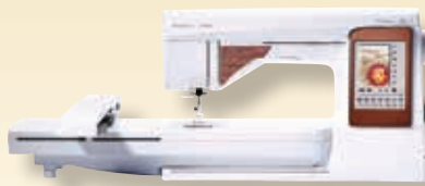
DESIGNER TOPAZ™ 50