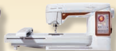
DESIGNER TOPAZ™ 40