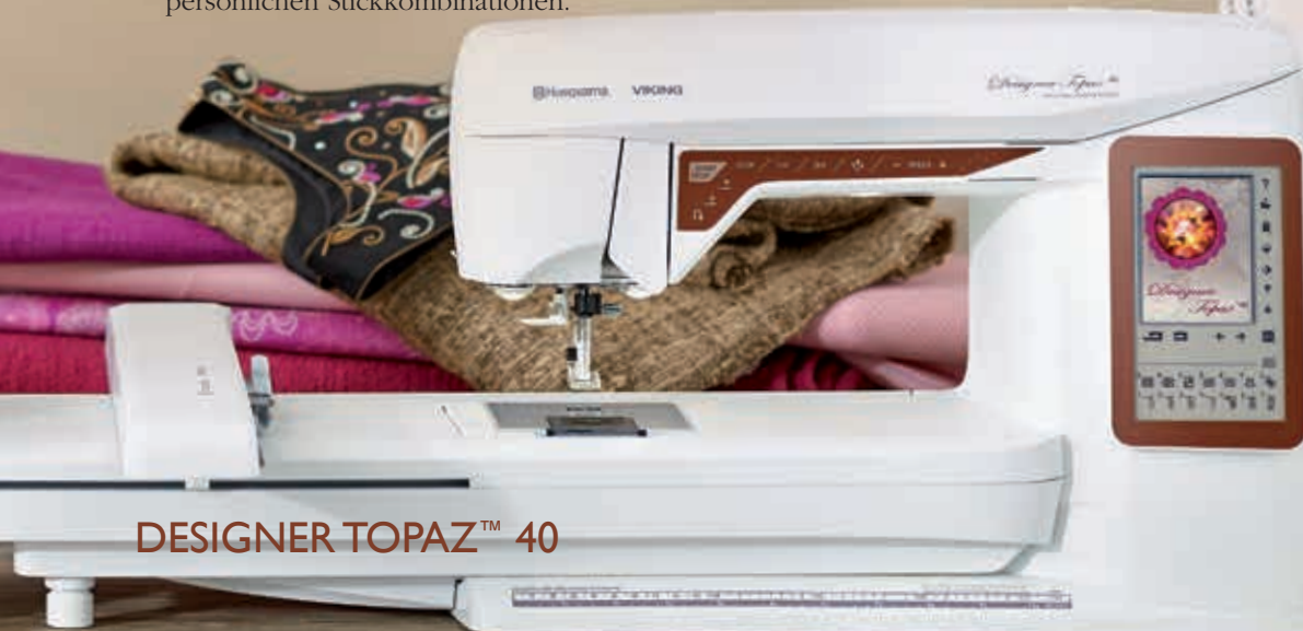
DESIGNER TOPAZ™ 40

Beeindruckend: Mit der DESIGNER TOPAZ™ können Sie Ihre Stickereien direkt auf dem Color-Touchscreen bearbeiten. Verändern Sie Motive, z. B. durch Spiegeln, Skalieren oder Drehen. Durch das Kombinieren mit anderen Motiven und Schriftzügen kommen Sie immer wieder auf neue Ideen. Die Änderungen werden direkt auf dem Bildschirm angezeigt. Am Ende speichern Sie einfach Ihre persönlichen Stickkombinationen.